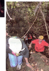
Tough climb at Gua Keuang cave complex.